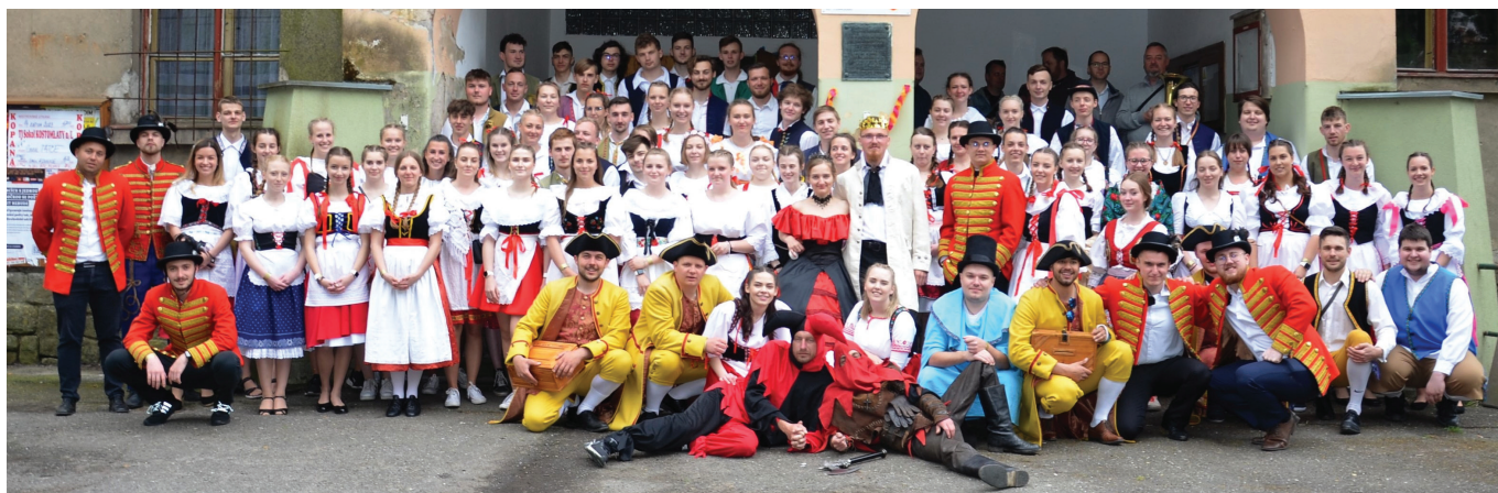
Staročeské Máje

„Jménem všech krojovaných bych vám chtěla poděkovat. Ať už za pomoc s postavením velké májky, za vaši projevovou přízeň a účast. V neposlední řadě děkuji za vybrané peníze, které nám pomohou naši tradici udržet. Příští rok se budeme těšit na nové i staré tváře.“ Bára Prošková